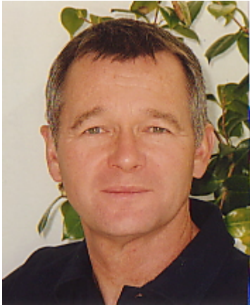
Bilder: La parada

Ich freue mich, euch in einer kleinen Vorschau zu meiner Ausstellung im Juni, ein paar Werke zum Thema Tanz präsentieren zu können und lade euch ganz herzlich zum Besuch meiner Website www.neukommstudio.ch und zur Vernissage vom 2.6.06 in Bern ein.